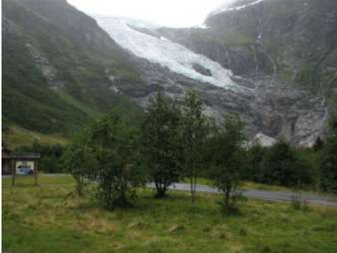
Boyabreen Gps N61 28.997 E6 45.099

Als je nog geen genoeg hebt van de gletsjers dan in Sogndal weg 55 richting Gaupne nemen.