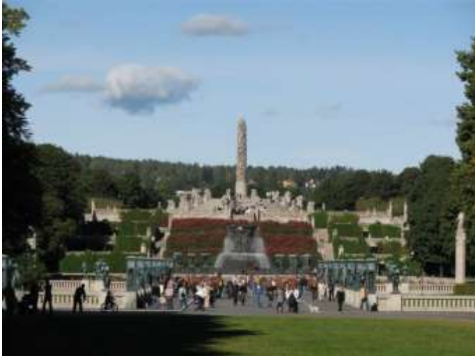
Vigelandspark Gps N59 55.476 E10 42.464 entree http://www.vigeland.museum.no/