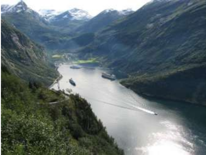
Geirangerfjord Gps N62 07.573 E7 10.079

Weg naar Geiranger nemen en 7 km voor Geiranger is de Ørnesvingen, een prachtig uitzichtpunt.