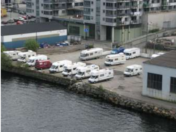
Bobilparking Gps N60 22.944 E5 19.085

Vanuit Bergen via de E16 overgaand in de E39 de afslag naar de 580 richting Espeland/ Indre Arna en Voss. In Indre Arna de E 16 nemen richting Voss.