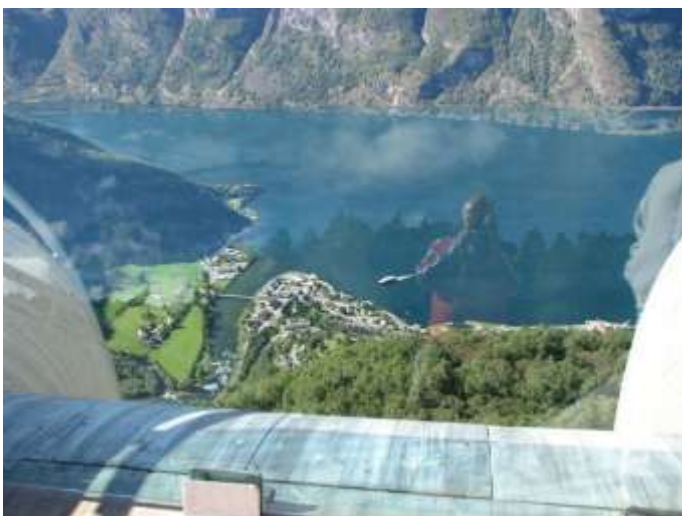
Uitzicht op Aurland Gps N60 54.492 E7 12.774