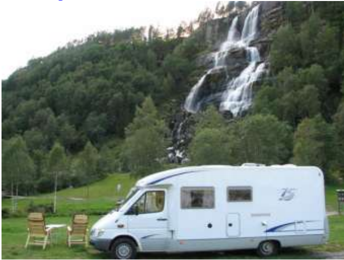
Tvindefoss Gps N60 43.592 E6 29.377

Weer terug naar de 13/E16 en voorbij het meer is de camping met waterval Tvindevoss te zien. http://www.tvinde.no/