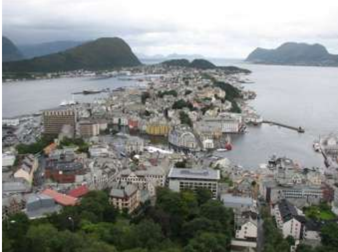
Alesund vanaf de Aksla

Je kunt een 417 trede tellende trap naar het Uitzichtpunt Aksla Fjelstue nemen. Onderweg genoeg bankjes en hele mooie vergezichten. Boven angekommen kun je de mooiste foto's schieten van Alesund en omgeving. Met de camper, auto en motor kun je ook boven komen. Bordjes Aksla Fjelstue volgen Gps N62 32.682 E7 43.173