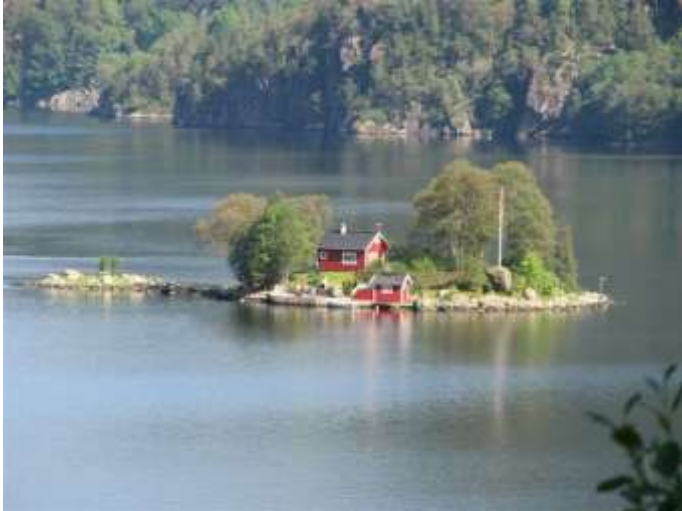
House on the little Island Gps N59 24.320 E6 12.174

De 520 wint het van de 13 op dat traject.