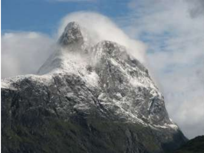
Onderweg langs E136