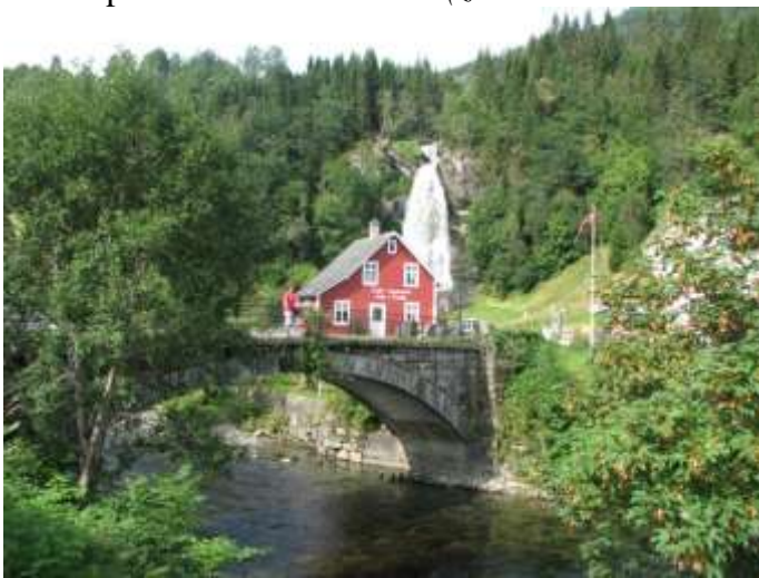
Steindalsfossen Gps N60 22.203 E6 06.376

Onderweg voorbij Norheimsund een waterval langs de weg de Steindalsfossen. Er is een wandelpad achter de waterval. (zie ook kleine wandelingen 20A)