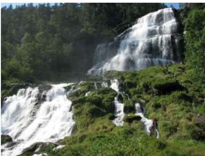
Svandalsfossen Gps N59 37.547 E6 17.542

Voor Sauda (rechts een P) zijn de Svandalsfossen.