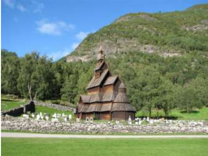
Stavkyrk Borgund Gps N61 02.916 E7 48.854

Terug naar Laerdal en daar de oude bergweg tussen Laerdal en Aurland 243 (Snovegen) nemen een zeer mooie route met mooie uitzichten. Het mooiste uitzicht punt zit bijna op het einde van deze weg waar je op een indrukwekkende wijze de Aurlandsfjord in kunt kijken.