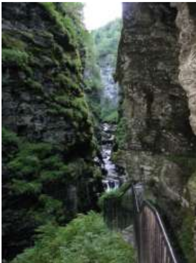
Bordalsgjelet Gps N60 36.756 E6 25.366

Daar ligt na het bebouwde gebied direct na een brug een kleine parkeerplaats (onverhard) met een informatiebord.