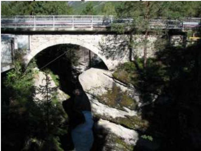
Gudbrandsjuvet Gps N62 19.845 E7 28.246

Na de top is onderweg de Gudbrandsjuvet kloof te zien.