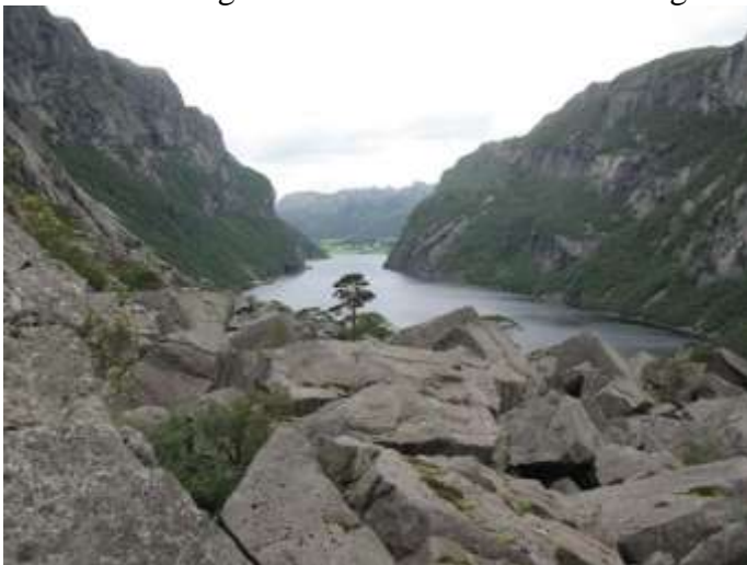
Gloppedalsura Gps N58 46.049 E6 16.696

In Byrkjedal is een leuke souvenir winkel en er zijn leuke oude huisjes een kaarsenmakerij etc. In Byrkjedal 10 min weg 503 nemen om de Gloppedalsura (Gerollhalde Gloppura) te zien. Dit is het grootste stenenveld van Noorwegen heel apart om te zien.