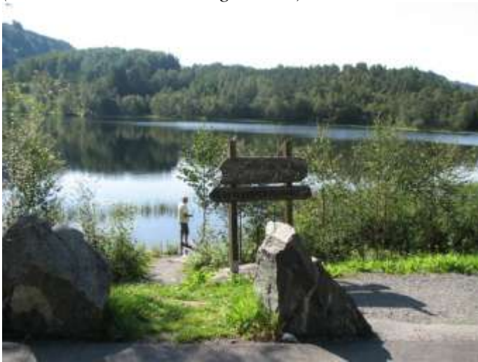
Goldfishlake Gps N60 23.427 E6 11.858

Onderweg voorbij Norheimsund een waterval langs de weg de Steindalsfossen. Er is een wandelpad achter de waterval. (zie ook kleine wandelingen 20A)