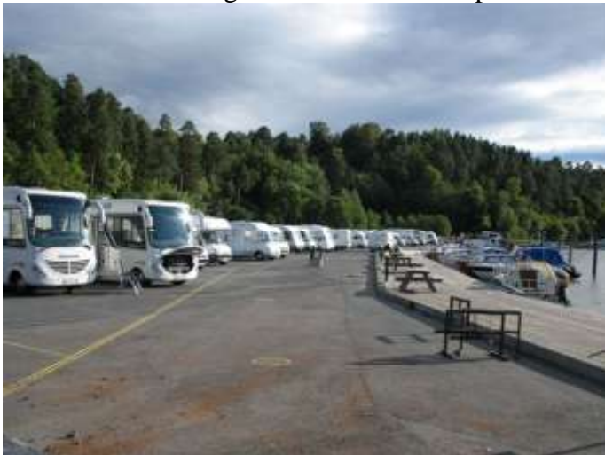
Bobilparking Gps N59 55.147 E10 40.625

http://www.bogstadcamping.no/ger/sommer.php gelegen het dichtsbij het Vigelandspark http://www.ekebergcamping.no/index-german.html gelegen op de route naar huis via Zweden. Met een camper kun je ook op een speciaal voor campers bedoelde parkeerplaats staan, alle faciliteiten aanwezig. Het is ca. 30 min lopen naar het Vigelandspark zie track.