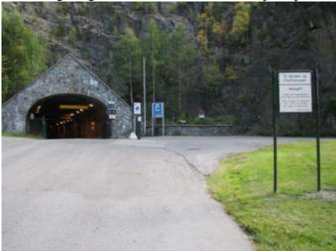
Spiralen Gps N59 45.187 E10 12.154

We verlaten de E 134 naar de 283 richting Nedre Eiker en Drammen. Deze weg volgen en in Drammen de bordjes Spiralen/ spiraltoppen volgen.