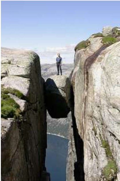
Kjeragbolten bij Lysebotn

Onderweg naar Lysebotn is bij de Oygardstol (restaurant/ uitzicht) een mooie wandeling te maken naar de Kjeragbolten. Daar ook even uitstappen voor een paar mooie foto's!