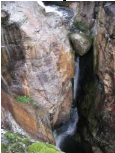
Dorgefoss. Gps N58 51.528 E6 47.312

Bij Svartevath even rechtdoor (op de 468 richting Tonstad) en bij Handeland een uitzicht op de waterval Dorgefoss